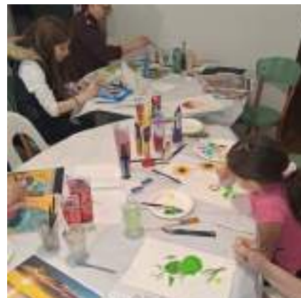
semaine culturelle CCGPF/UAICF 2025

C'est amener les jeunes à devenir des « consomm-acteurs », engagés à la fois dans la pratique de leur