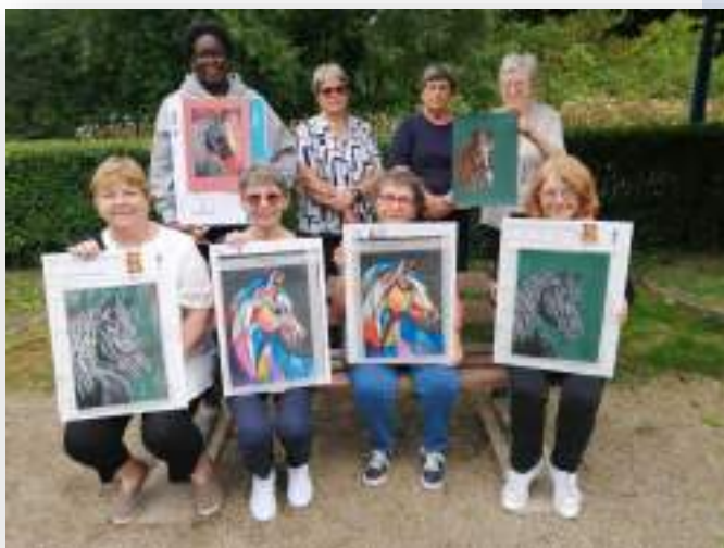
stage régional de pastel