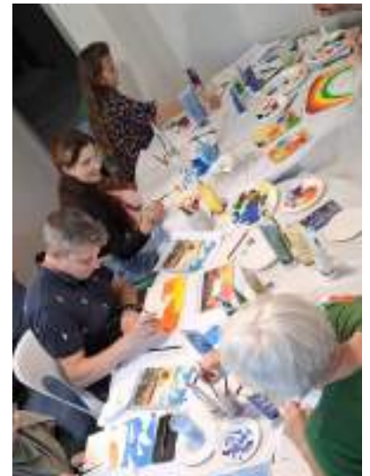
Semaine culturelle 2025 - Atelier Aquarelle intergénérationnel

Rédaction : les membres élus du bureau du siège de l'UAICF