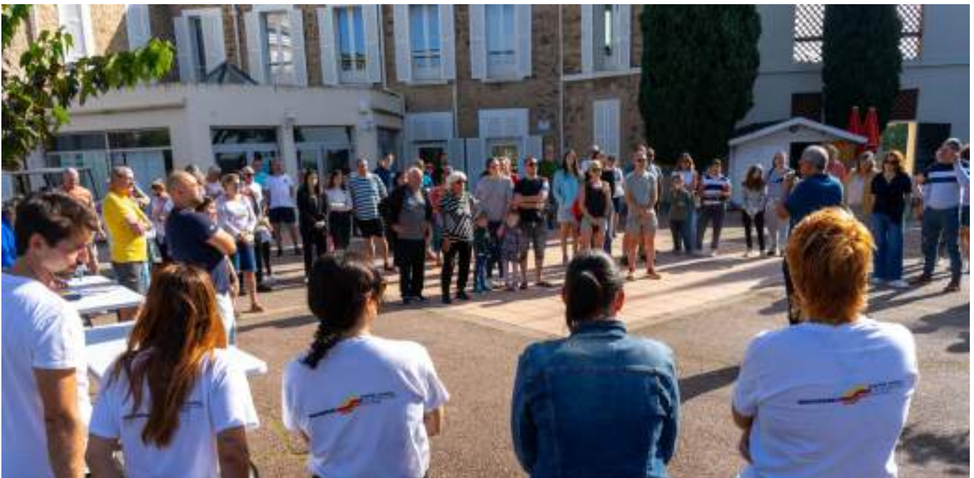
Photo Semaine culturelle CCGPF/UAICF - Saint-Mandrier 2024