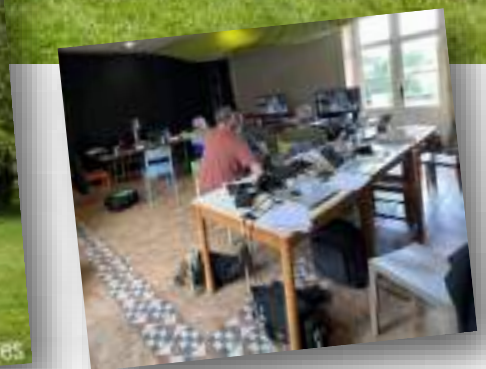
Stage photos 2025