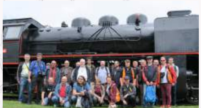
Modélisme 2024 - Bratislava (Slovaquie)

En participant à ces 6 événements, l'UAICF confirme son attachement à la coopération internationale et contribue activement à faire vivre l'esprit de fraternité entre cheminots au-delà des frontières.