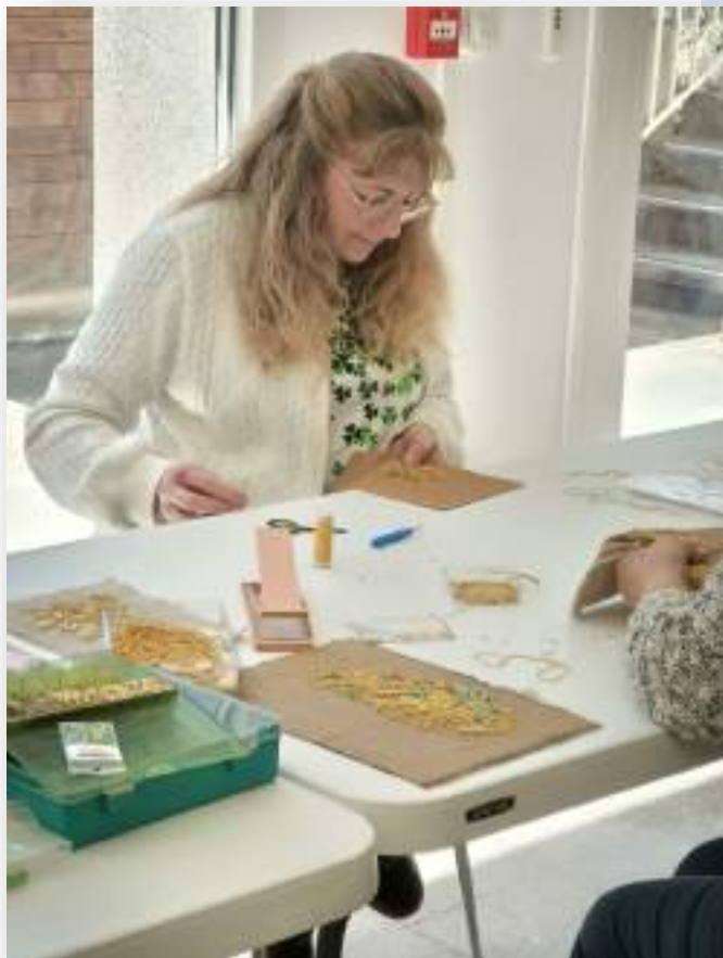
stage régional de broderie

Remercions le professionnalisme et le dévouement de nos animateurs UAICF bénévoles et les associations porteuses de ces projets. Cette alliance fait le dynamisme du comité !