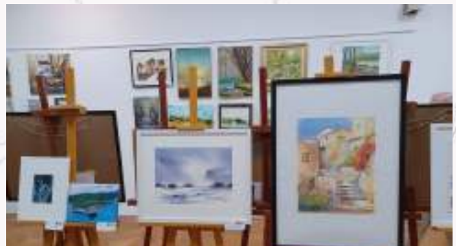
Expo Arts graphiques et Plastiques - 2024 - Croatie