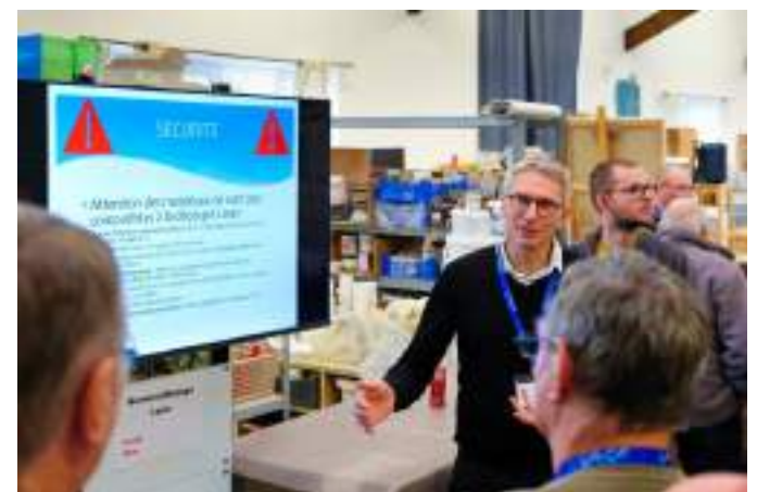
Le numérique au service des idées