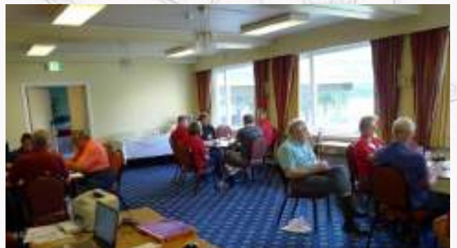
Tournoi de Bridge - 2018 - Voss (Norvège)